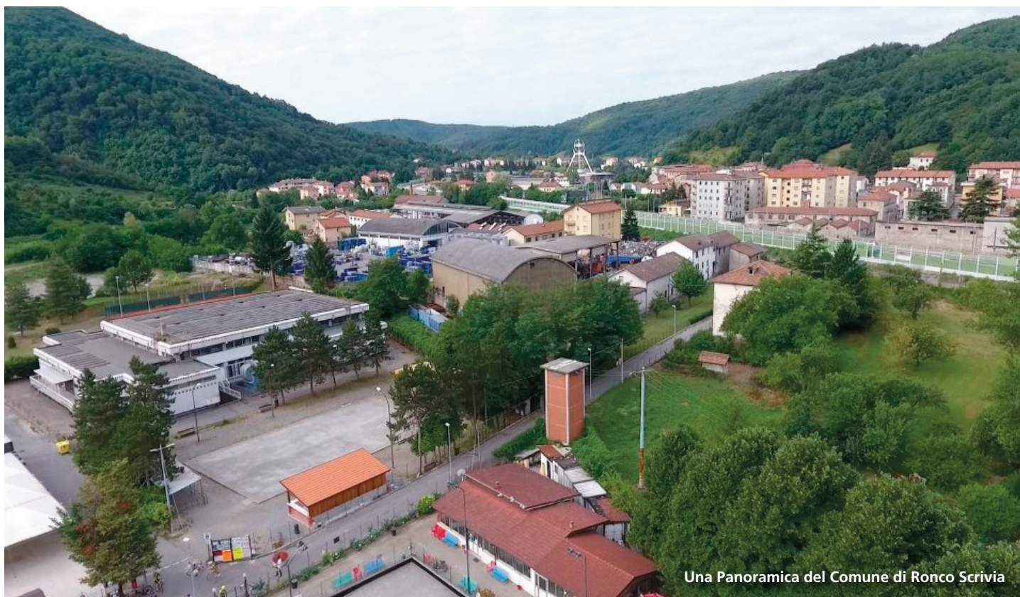
Una Panoramica del Comune di Ronco Scrivia

In questo caso il Comune di Ronco Scrivia andrà ad individuare l'utenza che sarà coinvolta nell'intervento abitativo proposto. La stessa amministrazione comunale, attraverso la stipula di una convenzione da sottoscrivere con Abitare in Liguria e Mise Coop , erogherà una somma per ogni alloggio realizzato con cui coprire le spese di affitto.